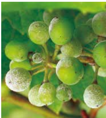
Făinarea viței de vie ( Uncinula necator )