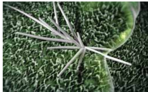
Roua sau ploaia mobilizează mici părți ale substanței active Xemium® din depozitele create și activează redistribuirea intensă pe suprafața frunzei