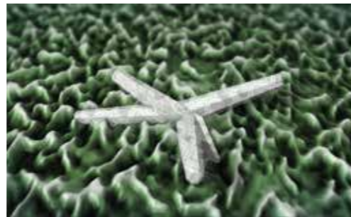
Formarea cristalelor care aderă puternic la stratul ceros al frunzelor