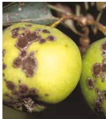
Rapănul mărului ( Venturia inaequalis ) Rapănul părului ( Venturia pirina )