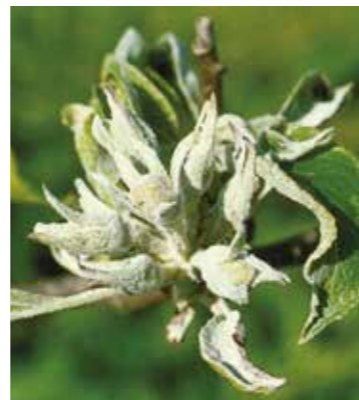
Făinare ( Podosphaera leucotricha )