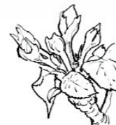
Muguri florali vizibili