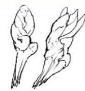
Urechișe de șoarece