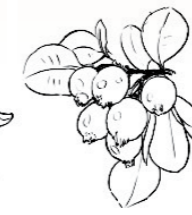
Fruct 30-40 mm