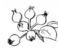
Fruct 20 mm