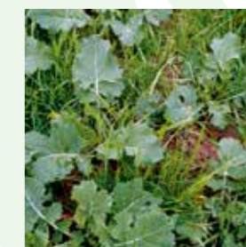
Samulastra de cereale (stadii timpurii)

Cu Cleravo® Flex poți avea încrederea că principalele buruieni sunt combătute. În plus, este o soluție completă, care nu necesită amestecul cu alte erbicide.