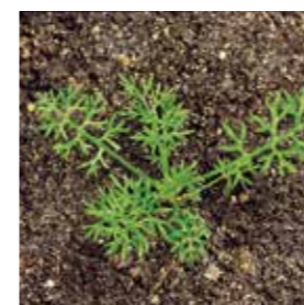
Principalele buruieni dicotiledonate

Cel mai larg spectru de combatere a buruienilor în rapiță